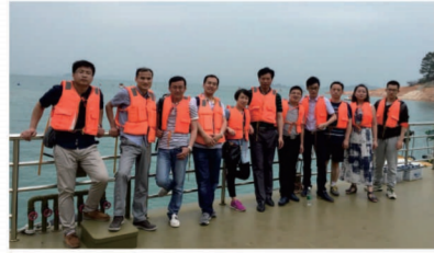
员工在温泉景区合影